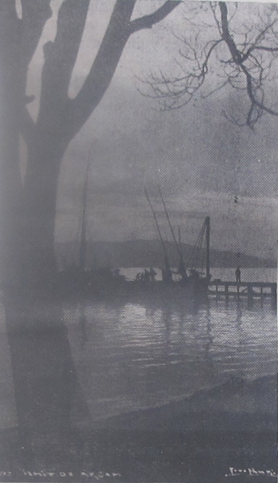
İzmit Körfezinde akşam

Birkaç satırcıkla tarihinden bahsettiğimiz meşhur helvanın ismini nereden aldığını eminim ki onu imâl eden şekerciler dahi bilemezler, kimbilir belki —Alan bir, Almıyan bin pişman— tekerlemesinden belki de imâl edenlerin karşılaştığı müşküllerden meydana çıkmıştır. Bilinmiyor, bilinemeyecek de! Yalnız biz şunu kat'iyetle söyleyebiliriz ki eğer ortada bir pişman olan varsa alan değil yapan'dır. Filhakika imalât esnasında gösterilecek ufak bir ihmâl, yapılacak küçük bir hatâ ile bütün masraf ve emeklerin heba olacağı nazarı itibara alınırsa imâl edene hak vermemek elden gelmez değil mi aziz okuyucular?... 49