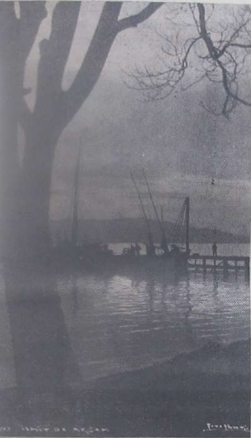
İzmit Körfezinde akşam